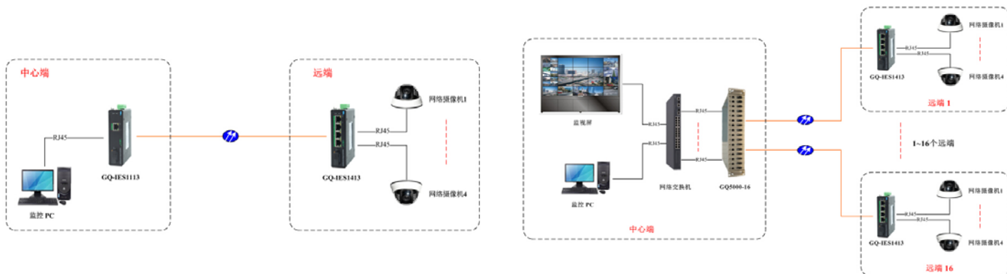
方案一: 点对点应用